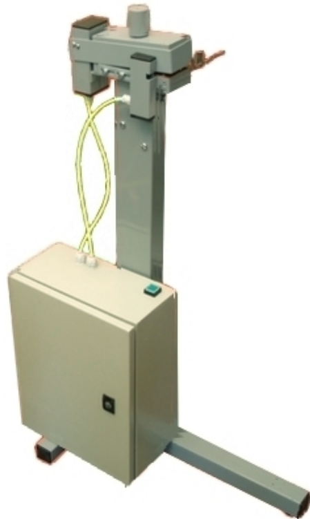
Profi-Eurolochstanzgerät mit elektrischem Antrieb

Das PROFI-Euroloch-Stanzgerät stantzt bis zu 3 mm Dicke. Damit lassen sich preisgünstig Blisterverpackungen für Verkaufsregale herstellen.